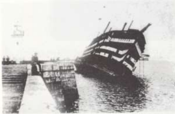
L'épave du Borda à Cherbourg.