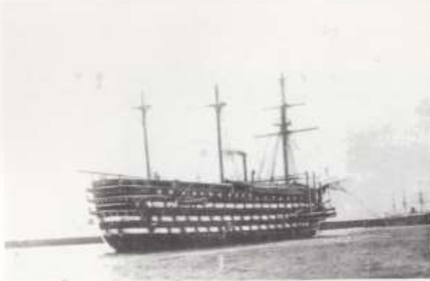
La dernière photo du vaisseau-école Borda (29 juillet 1913).