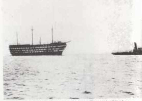
Le Borda , remorqué de Brest à Cherbourg, par le remorqueur Abeille n° 10 (juin 1914).