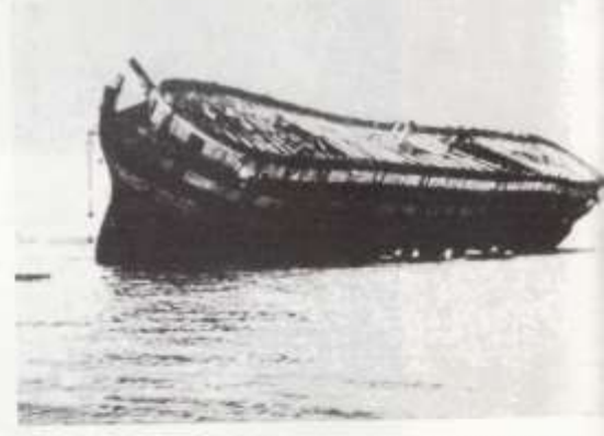
L'épave du Borda , en cours de démolition.

Le vieux "BORDA", fut remorqué de Brest à Cherbourg, par un remorqueur de la Compagnie "Les Abeilles" et conduit au cimetière des navires, près de la grande jetée, le 28 juin 1914. Il acheva là sa carrière misérablement. "Transformer en épave humiliante ce qui avait été l'École Navale ! La demeure sacrée de tant de souvenirs ! Mais la mettre à l'encan, la réserver au dépeçage sordide, ce sont des crimes ! Je dis bien des CRIMES et de lèse majesté" s'est écrié La Varende dans un élan de noble indignation.